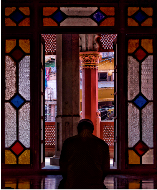
Nje njeri duke u falur në xhaminë Nakhoda, Indi.

Ajeti më tutje thotë se Zoti do të na vërë në sprovë me “humbjen e pasurisë, frymëve, dhe frutave” ( ue naksin min el-emuali ue el-enfusi ue el-themerat ). Fjala në arabisht naks ka shumë kuptime, njëri prej të cilëve është humbje apo pakësim . Ne do të sprovohemi, pra, me humbjen apo pakësimin e pasurisë si edhe me humbjen apo pakësimin e jetës: njerëzit humbasin kujtesën, shikimin, dëgjimin, gjymtyrët, të dashurit, miqtë, kafshët shtëpiake, dhe kështu me radhë – të gjitha këto ne i marrim si të mirëqena derisa ato të mos jenë më. Asnjë jetë nuk i shpëton këtij rregulli. Humbja në fjalë është në rrënjë të natyrës së këtij vendbanimi, dhe, duke përqafuar humbjet që ne përjetojmë përgjatë rrugës, ne mund të përftojmë urtësi të madhe. Sikurse ka shkruar Shekspiri: “Lermë të të përqafoj, o fatkeqësi, burrat e mençur thonë se ti je udha më e mençur.”