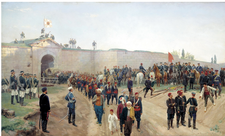
Kapitullimi osman në Nikopol gjatë luftës turko-ruse, Nikolai Dmitriev-Orenburgsky, 1883

Me reagimet e këtyre tre personazheve mitike ndaj panoramës së detit në rrezet e diellit që frymëzon drojë, Melvil rrok mjaft qartë totalitetin e reagimeve njerëzore ndaj bukurisë së shkëlqyer të botës së natyrës. Ahabi, skeptiku konfliktual, mund të besojë në një krijues të padukshëm nëqoftë se ditët e tij do të ishin gjithnjë të lavdishme sa ajo ditë e qetë, e prehur, dhe e paqte teksa ai hedh vështrimin mbi oqeanin e gjerë, të shirë dhe të qetë. Por sprovat e tmerrshme të botës – përfshirë edhe humbjen e këmbës nga një balenë gjigante që e bëri atë t'i jepej kërkimit të hakmarrjes – e mbushin mendjen e tij me dyshim dhe obsesion. Besimi në mendjen e hidhëruar të Ahabit përfaqëson pafajësinë e një nxënësi të vogël i cili më vonë do të përballet me realitetet tragjike të jetës. Përgjigja e tij i ngjason asaj të Hamletit të Shekspirit në stadin e tij të hershëm (Melvili e njihte shumë mirë këtë tragjedi), kur Hamleti vë në diskutim kuptimin e jetës ose pakuptimësinë e saj në monologun e tij të famshëm “Të jesh a të mos jesh”. E megjithatë, ndryshe nga Hamleti, i cili e zgjidh krizën e tij aty nga fundi i veprës tragjike me kuptimin se “të qenit gati është gjithçka”, Ahabi ngelet një skeptik i pandreqshëm.